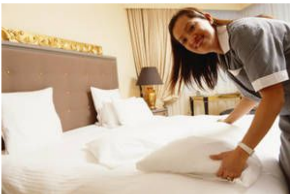
Une femme de chambre